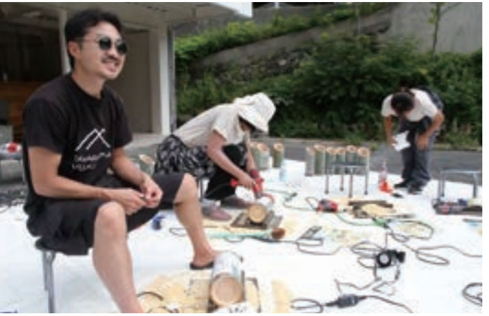
地域の活性化を舞台に人材の教育に取り組む活動 2023年へ向け若者達はどのような成長を歩むのか 地域や仲間との繋がりの中で日々成長しながら 俵山ビレッジで暮らすメンバーを紹介します